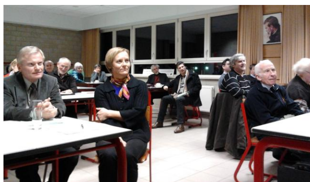
Ronde van schoolbesturen Foto rechts boven: Virgo Sapiens Londerzeel Foto midden: Don Bosco Halle Foto onder: Sancta Maria Aarschot

Tijdens onze Ronde van schoolbesturen hebben wij niet te veel willen spreken over de plannen van de Minister omdat die nog niet duidelijk en definitief waren, maar vooral omdat we de schoolbesturen graag in beweging zetten, niet omdat de overheid van plan is schaalvergroting op te leggen, maar omdat we vanuit het katholiek onderwijs zelf overtuigd zijn dat een dergelijke krachtenbundeling kan bijdragen tot versterking van de schoolbesturen, zeker de kwetsbare. Een veranderingsproces heeft immers maar kans op slagen als men er een duidelijke meerwaarde of win-winsituatie in ziet, en niet ‘omdat het nu eenmaal moet’. Zo’n ingrijpend proces moet ook de nodige rijpingstijd krijgen en – heel belangrijk – er mag niemand uit de boot vallen.