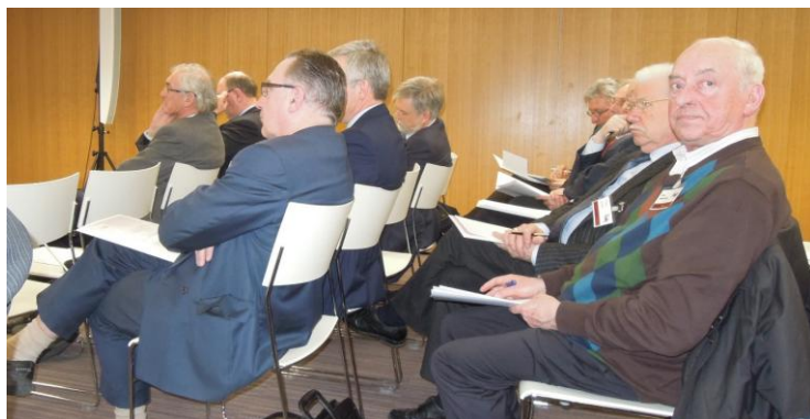
Foto onder: een bisdomoverschrijdende werkgroep

De koepel heeft in haar ogen vier hoofdopdrachten: duidelijk maken op welke manier we vandaag katholiek geïnspireerd onderwijs willen zijn, professionele administratieve en juridische ondersteuning bieden, ondersteuning verlenen op pedagogisch gebied en