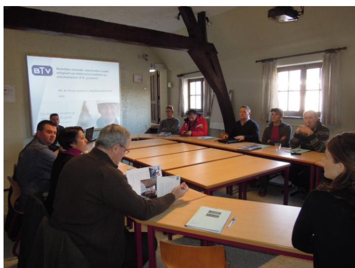
De Stuurgroep Preventie op vorming op 26 maart 2013 in VIA Tienen

De vorig schooljaar opgerichte diocesane stuurgroep van preventieadviseurs pakt binnenkort weer uit met een vormingsactiviteit en is intussen een hechte groep aan het worden. Dat bleek nog recent uit een vormingsvoormiddag voor de eigen stuurgroepleden.