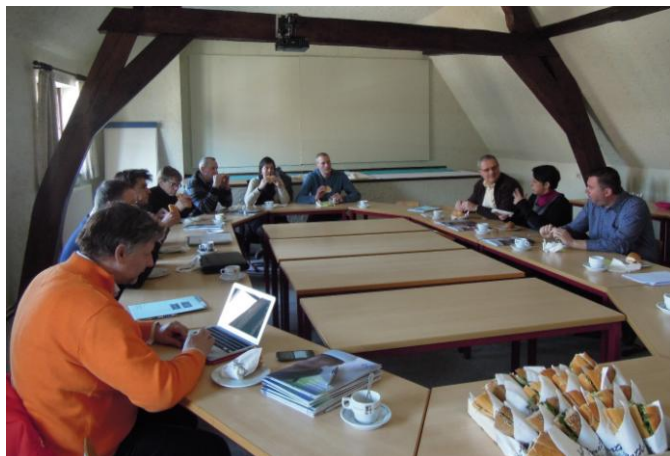
Foto: afsluitende maaltijd bij de vormingsactiviteit voor de Stuurgroep op 26 maart 2013 in VIA Tienen

kreeg met de link naar de inschrijvingsmodule bleken de 75 plaatsen voor de cursus al ongeveer allemaal ingenomen te zijn. Ook de inhoud bleek anders te zijn dan wat ons werd voorgespiegeld. De vorming was bedoeld voor wie al een intern noodplan had uitgewerkt en dat wou verfijnen, blijkbaar niet voor wie er nog aan moest beginnen. Een aantal kandidaten die via ons verwittigd werden, visten achter het net. Wij hopen het Departement Onderwijs er van te kunnen overtuigen de cursus in zijn basisopzet nog eens te organiseren. Er is blijkbaar voldoende nood aan.