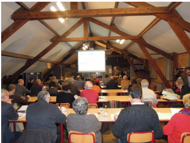
Bij de Ronde van schoolbesturen in Virgo Sapiens Londerzeel

Het Diocesaan Comité van Inrichtende Machten (DCIM) en het Vicariaat Onderwijs van het aartsbisdom Mechelen-Brussel hebben de zeven voorziene etappes van hun 'Ronde van schoolbesturen' afgewerkt. Er komt op 16 april 2013 nog een achtste etappe bij om alle schoolbesturen die nog niet 'mee gereden hebben' alsnog die kans te geven.