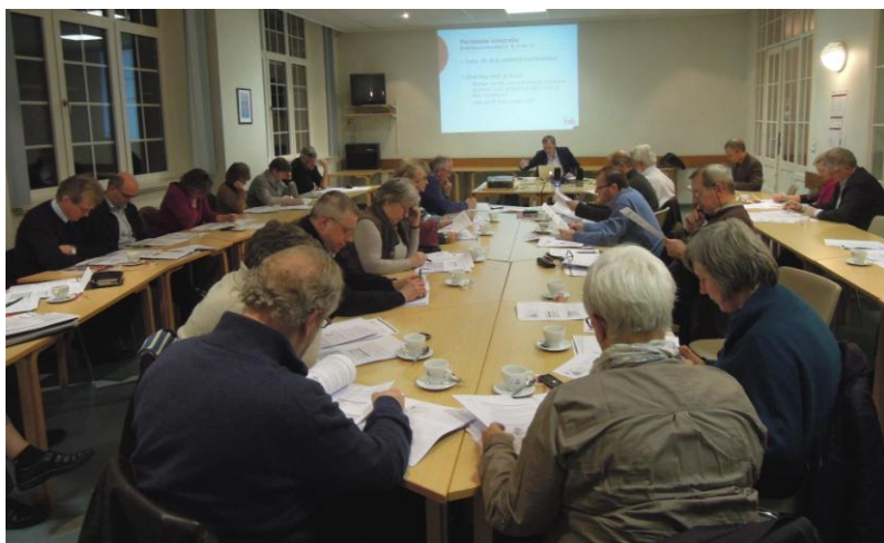
VIMKO-vorming ‘Bundelen van krachten’ in Groot-Bijgaarden op 19 maart 2013

Een dertigtal schoolbestuurders nam deel aan de Vorming ‘Bundelen van krachten’ die de VIMKO in ons bisdom organiseerde op 19 maart in het De la Sallecentrum in Groot-Bijgaarden.