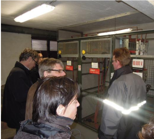
Foto: risicoanalyse elektrische installaties bij de vormingsactiviteit voor de Stuurgroep op 26 maart 2013 in VIA Tienen