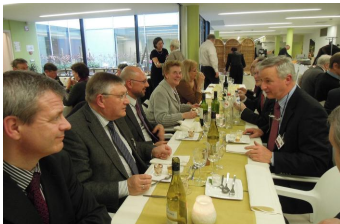
Een smakelijk buffet aangeboden door het VSKO

(snel) een antwoord moeten krijgen, zouden de vertegenwoordigers van de verschillende Verbonden van bij aanvang op één lijn moeten kunnen geraken in het Centraal Bureau en minder verdeelde standpunten naar buiten mogen brengen. Voorts neemt het VSKO beter een meer proactieve houding aan om meer te kunnen wegen op het politieke debat. Bij het proces van schaalvergroting van besturen verwachten we van het VSKO stimulerende initiatieven en deskundige ondersteuning om besturen gefaseerd naar grotere, sterkere gehelen te begeleiden, in samenwerking met de diocesane comités en de vicariaten.