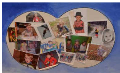
Collage rond het thema 'Kind in de kijker'

Van 16 tot 18 januari 2013 konden ruim 230 directeurs en pedagogische begeleiders basisonderwijs uit het aartsbisdom Mechelen-Brussel elkaar ontmoeten voor de twaalfde editie van het colloquium, in het feeëriekke, in sneeuw gehulde Houffalize. Ze kregen een mooi programma voorgeschoteld van referaten en werkwinkels met als rode draad: het Kind in de kijker. En er was ook plaats voor ontspanning.