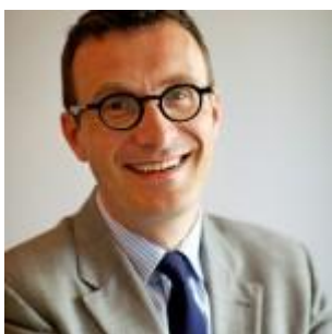
Minister van Onderwijs Pascal Smet

Scholen zouden zich volgens die maatregel tegen 2020 moeten verenigen in scholengroepen (van associaties is geen spraak meer). Die zouden onder één bestuur moeten komen en minimaal 2000 en gemiddeld 6000 leerlingen tellen, zonder een maximum. Die scholengroepen kunnen, maar moeten niet, niveauoverstijgend zijn en kunnen zich organiseren per regio maar ook over heel Vlaanderen. Voor de concrete uitwerking is het wachten op de officiële teksten, maar nu al is duidelijk dat de huidige structuur van scholengemeenschappen wellicht maar voor één keer verlengd zal worden vanaf 2014.